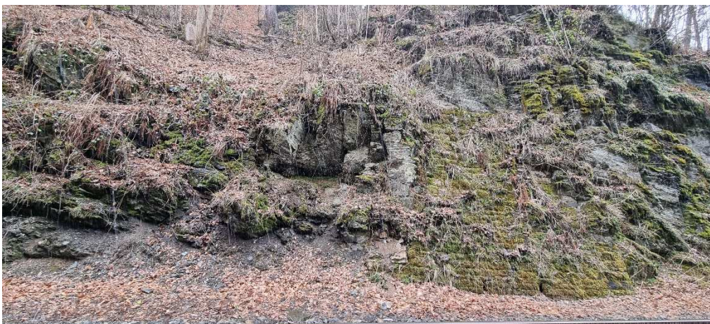
sanace stávající zděné plomby, zhotovení nové podezdívky, lokální kotvení skalních bloku, obnova akumulčního prostoru