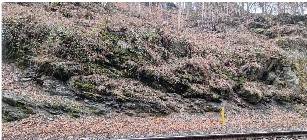
nová podezdívka, obnova akumulčního prostoru